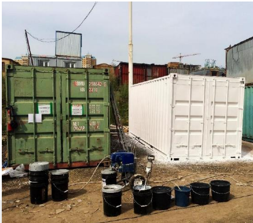
Contenedores gemelos. Uno sin aislante térmico y otro con TEMP-COAT 101